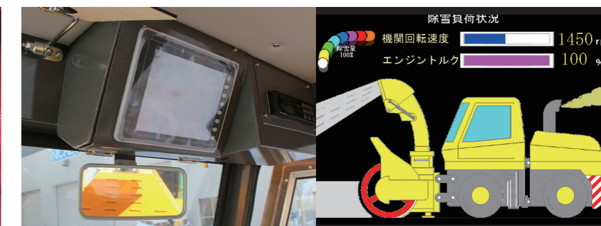
■ 車両状態確認モニタ仕様 (除雪負荷表示画面)