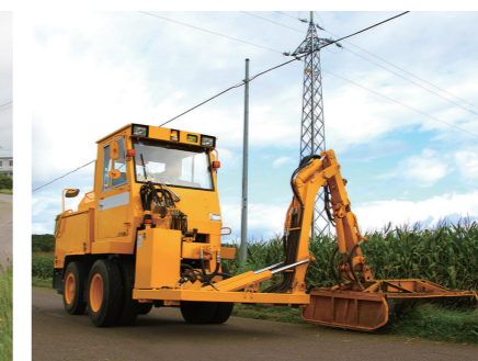
■ 草刈装置(ディスク式)