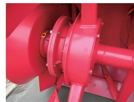
■ 運転室内操作復帰型 オーガシャーピンレス装置仕様 (油圧クラッチ式)

1.3m幅除雪装置仕様・ 運転室内操作復帰型オーガシャーピンレス装置仕様 ・ 車両状態確認モニタ仕様 等、安全対策となるオプションを豊富に用意しております。