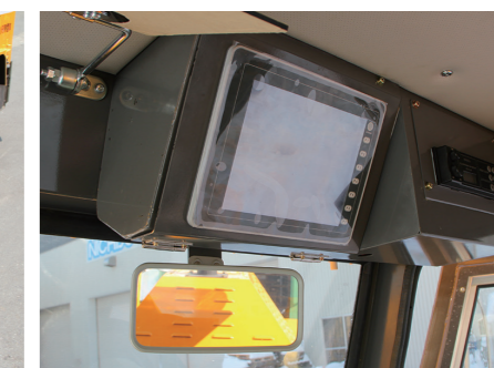
■ 車両状態確認モニタ仕様