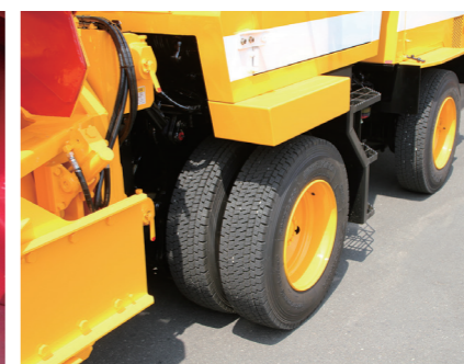
■ 前輪ダブルタイヤ仕様 (1.5m幅仕様に装備可能)