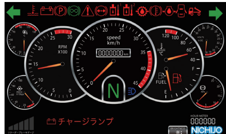
●大画面フル液晶ディスプレイメータ