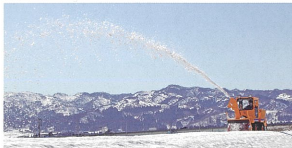
●高出力なエンジンによるダイナミックな除雪作業